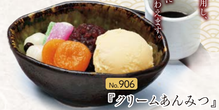
No.906 『クリームあんみつ』 573円(税込630円) ■357kcal ■塩分/0.2g

北海道の大地で育ったあずきを使用し、じっくりと丁寧に炊きあげました。やさしい甘さの中にあずきの風味が味わえます。