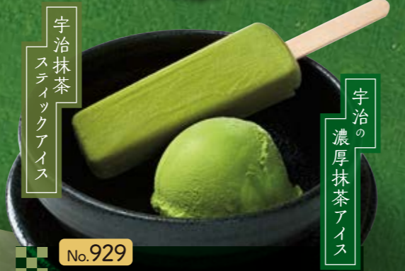
No.929 『抹茶アイス 食べくらべ』 491円(税込540円) ■197kcal ■塩分/0.1g