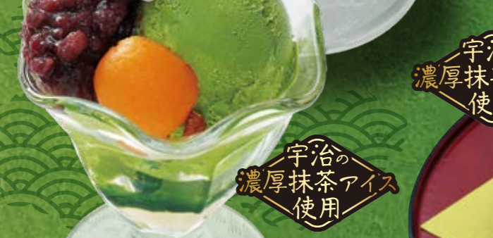
No.927 『抹茶のミニパフェ』 810円(税込890円) ■404kcal ■塩分/0.2g