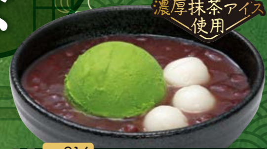
No.914 『冷やし抹茶ぜんざい』 573円(税込630円) ■411kcal ■塩分/0.2g