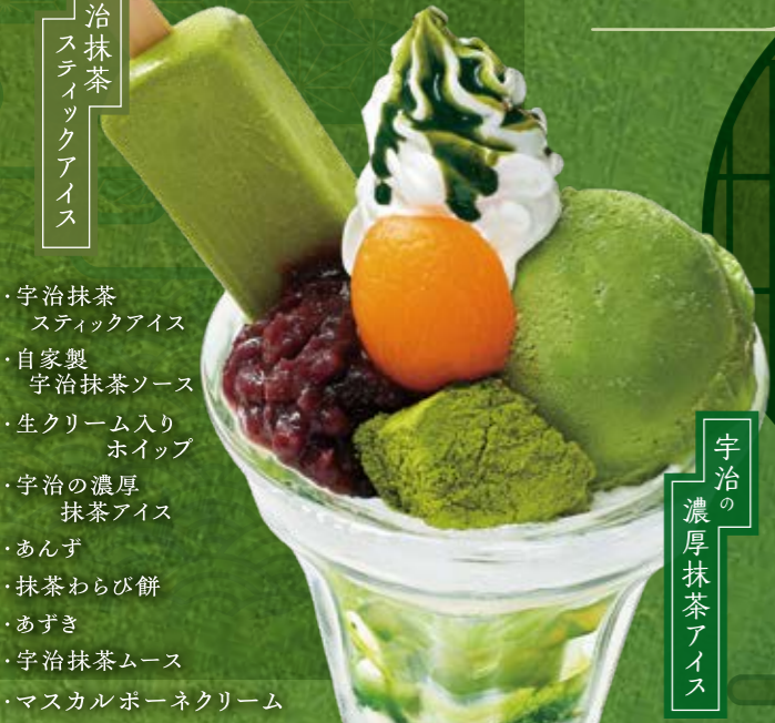
No.926 『濃い抹茶パフェ』 1,437円(税込1,580円) ■706kcal ■塩分/0.3g