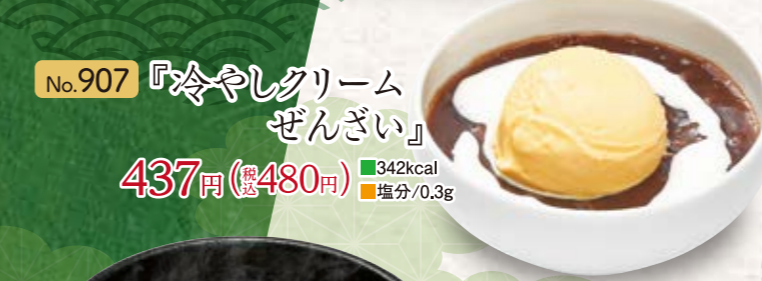
No.907 『冷やしクリームぜんざい』 437円(税込480円) ■342kcal ■塩分/0.3g