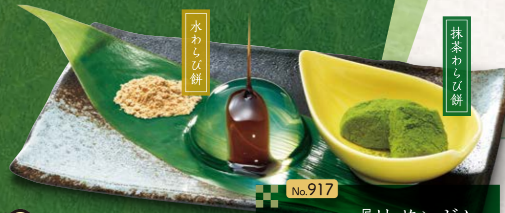
No.917 『抹茶しずく』 446円(税込490円) ■143kcal ■塩分/0.0g