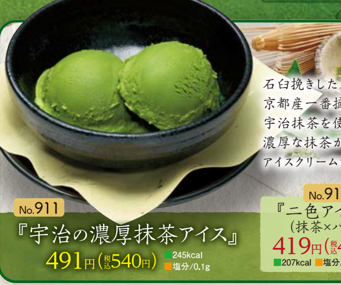
No.911 『宇治の濃厚抹茶アイス』 491円(税込540円) ■245kcal ■塩分/0.1g

ピーカンナッツが含まれている商品がございます。「くるみアレルギー」をお持ちの方はご注意ください。