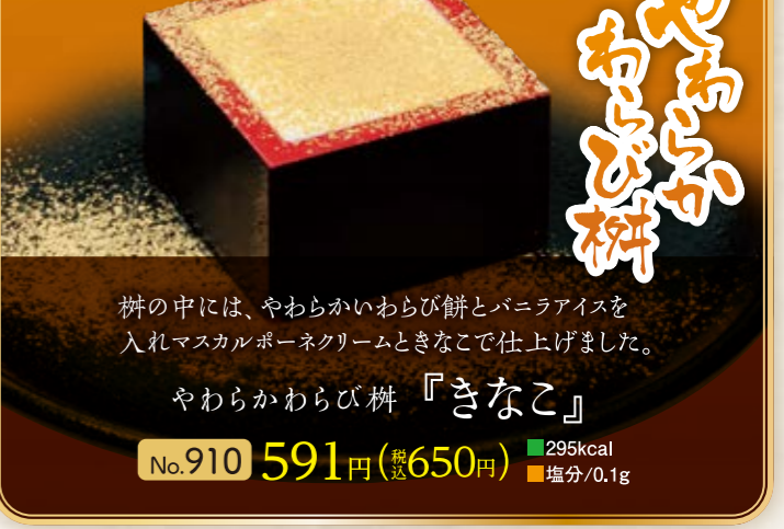
No.910 『きなこ』 591円(税込650円) ■295kcal ■塩分/0.1g