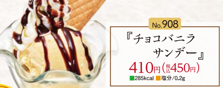
No.908 『チョコバナラサンデー』 410円(税込450円) ■285kcal ■塩分/0.2g