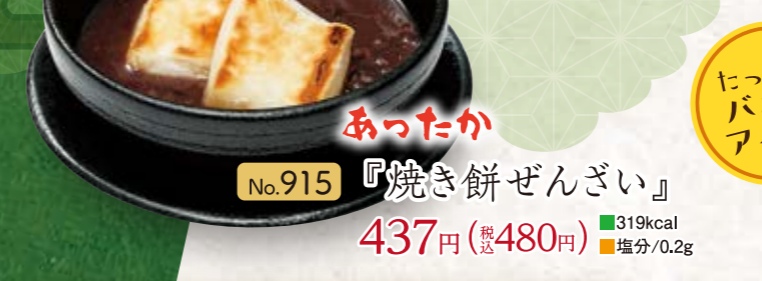
No.915 『焼き餅ぜんざい』 437円(税込480円) ■319kcal ■塩分/0.2g