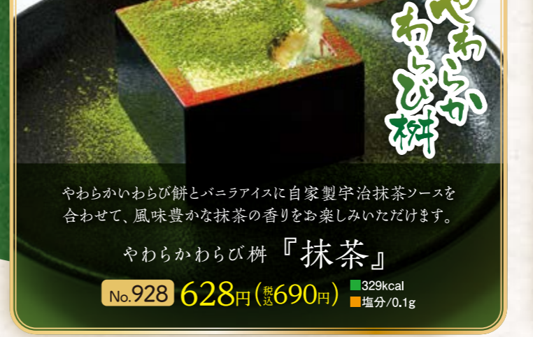
No.928 『抹茶』 628円(税込690円) ■329kcal ■塩分/0.1g