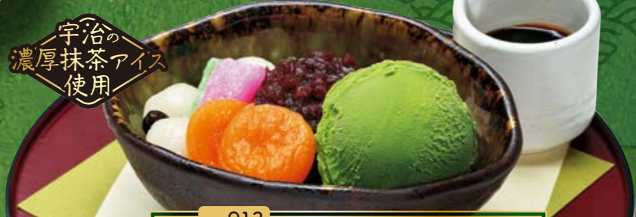
No.913 『濃厚抹茶アイスのクリームあんみつ』 655円(税込720円) ■395kcal ■塩分/0.2g