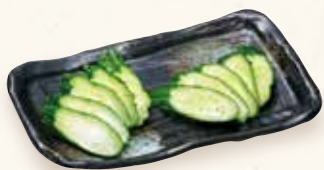
きゅうりの一本漬け