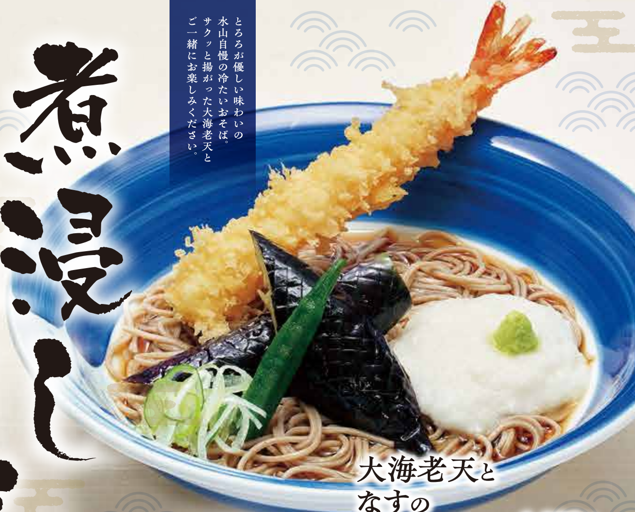
大海老天と なすの 煮浸しそば

とろろが優しい味わいの 水山自慢の冷たいおそば。 サクッと揚がった大海老天と ご一緒にお楽しみください。