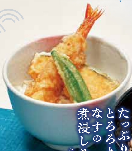
たっぷり とろろと なすの 煮浸しそばと ミニ天井