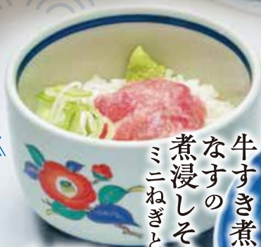
牛すき煮と なすの 煮浸しそばと ミニねぎとろろ井