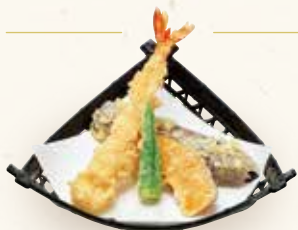
大海老天ぷら 盛り合わせ