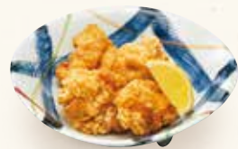
鶏のから揚げ (四個)