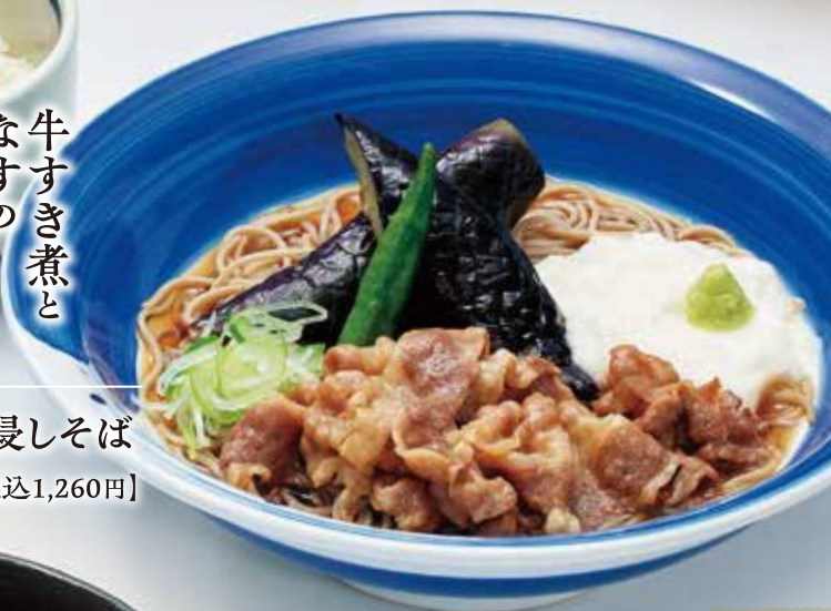
牛すき煮となすの煮浸しそば