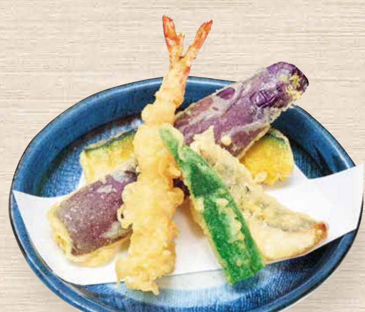
大海老天ぷら盛り合わせ 480円