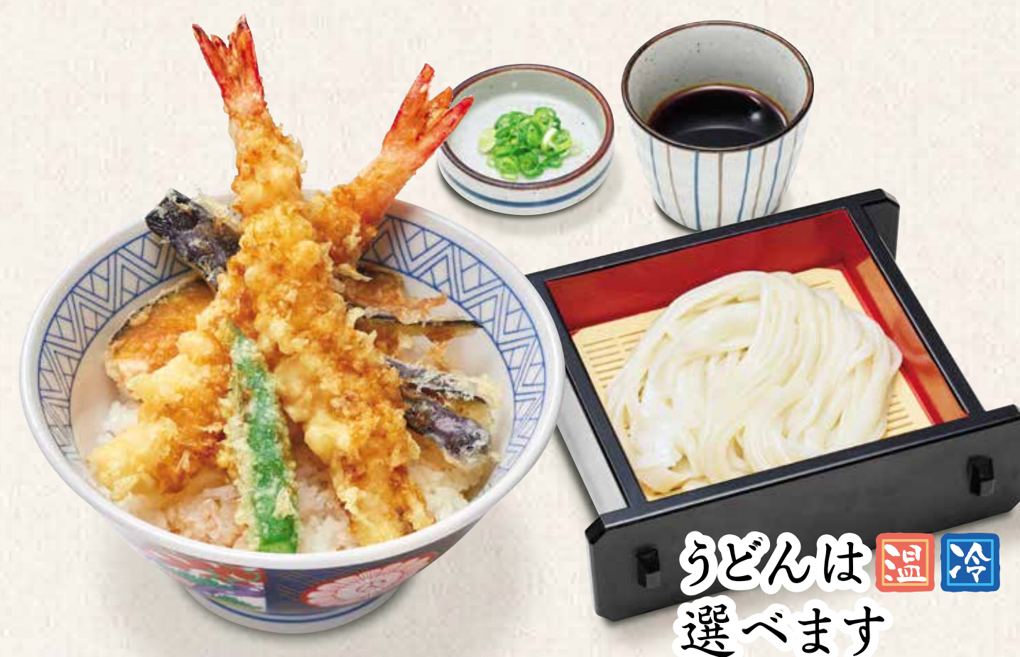
大海老上天井定食うどん付き 海老2尾 1,180円 うどんは温冷選べます