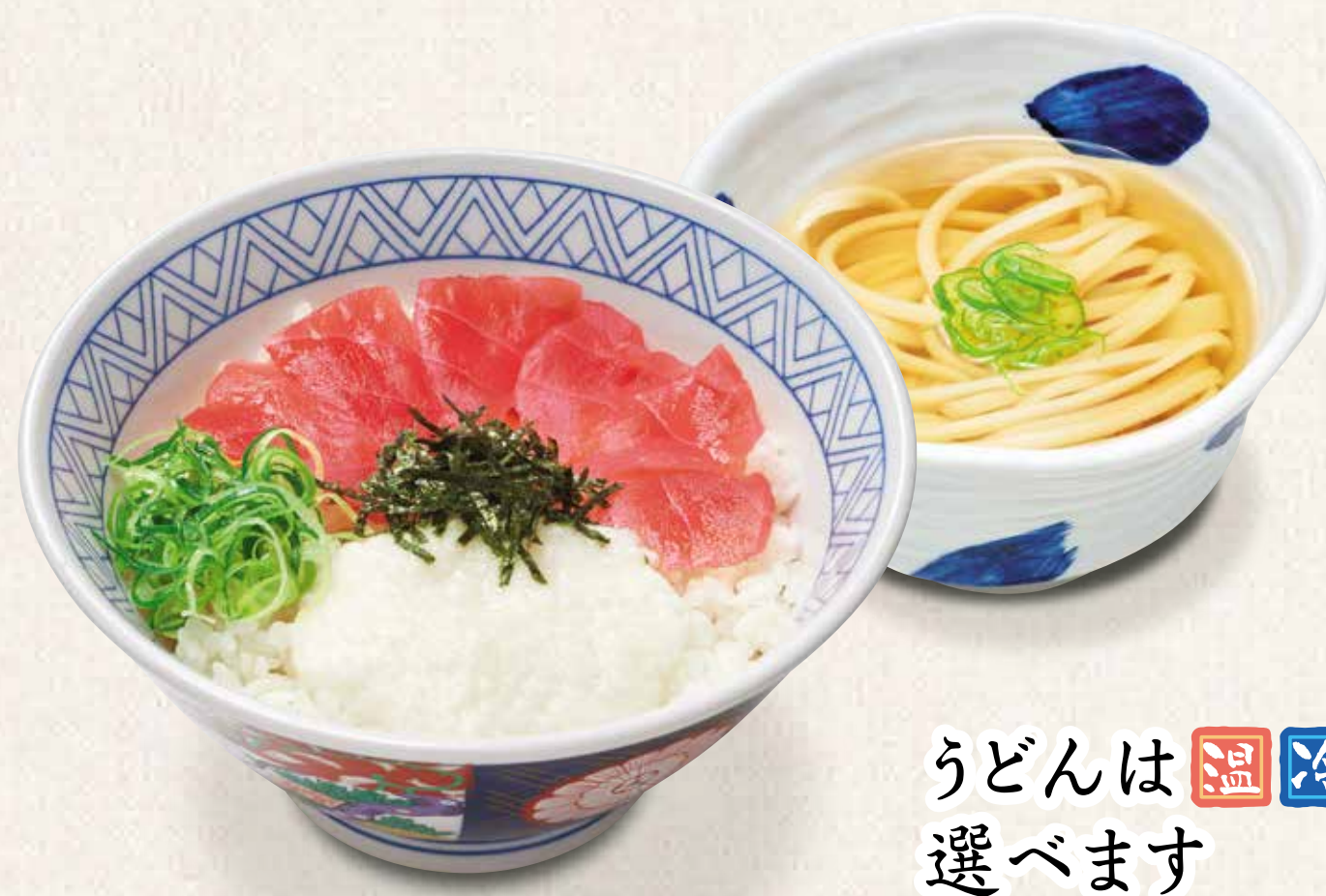
まぐろ山かけ井定食うどん付き 1,030円 うどんは温冷選べます