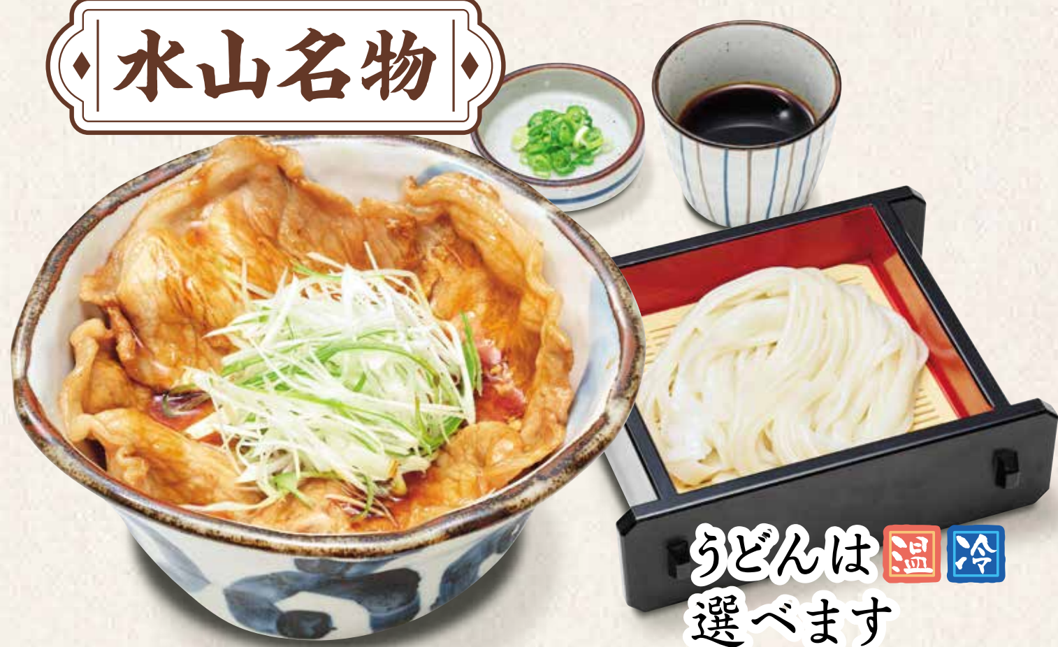
四元豚の豚井定食うどん付き 1,170円 うどんは温冷選べます