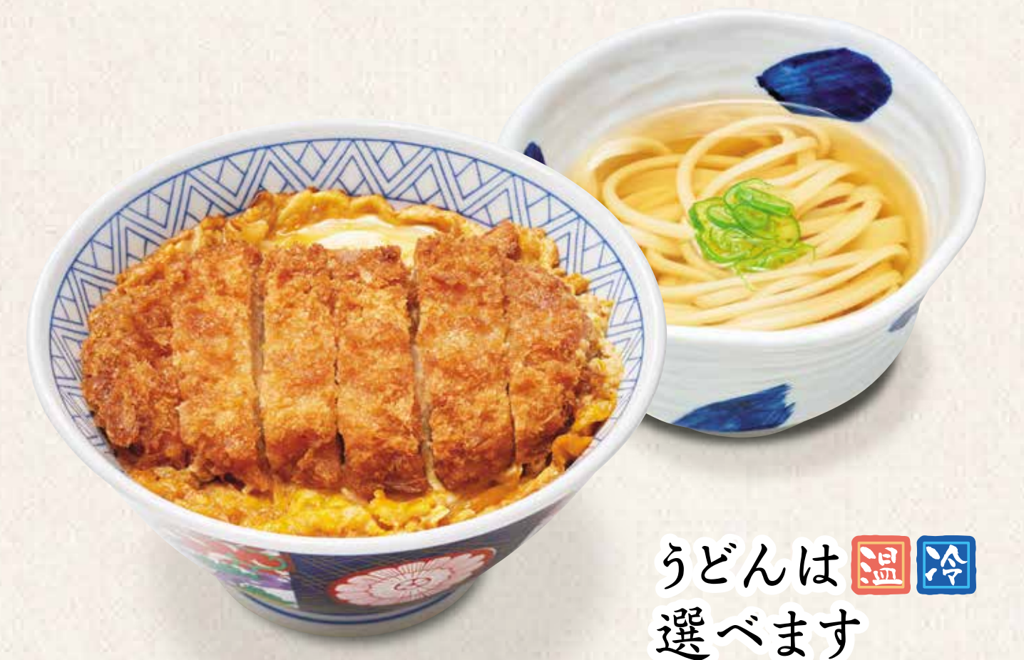
ローズかつ井定食うどん付き 1,070円 うどんは温冷選べます