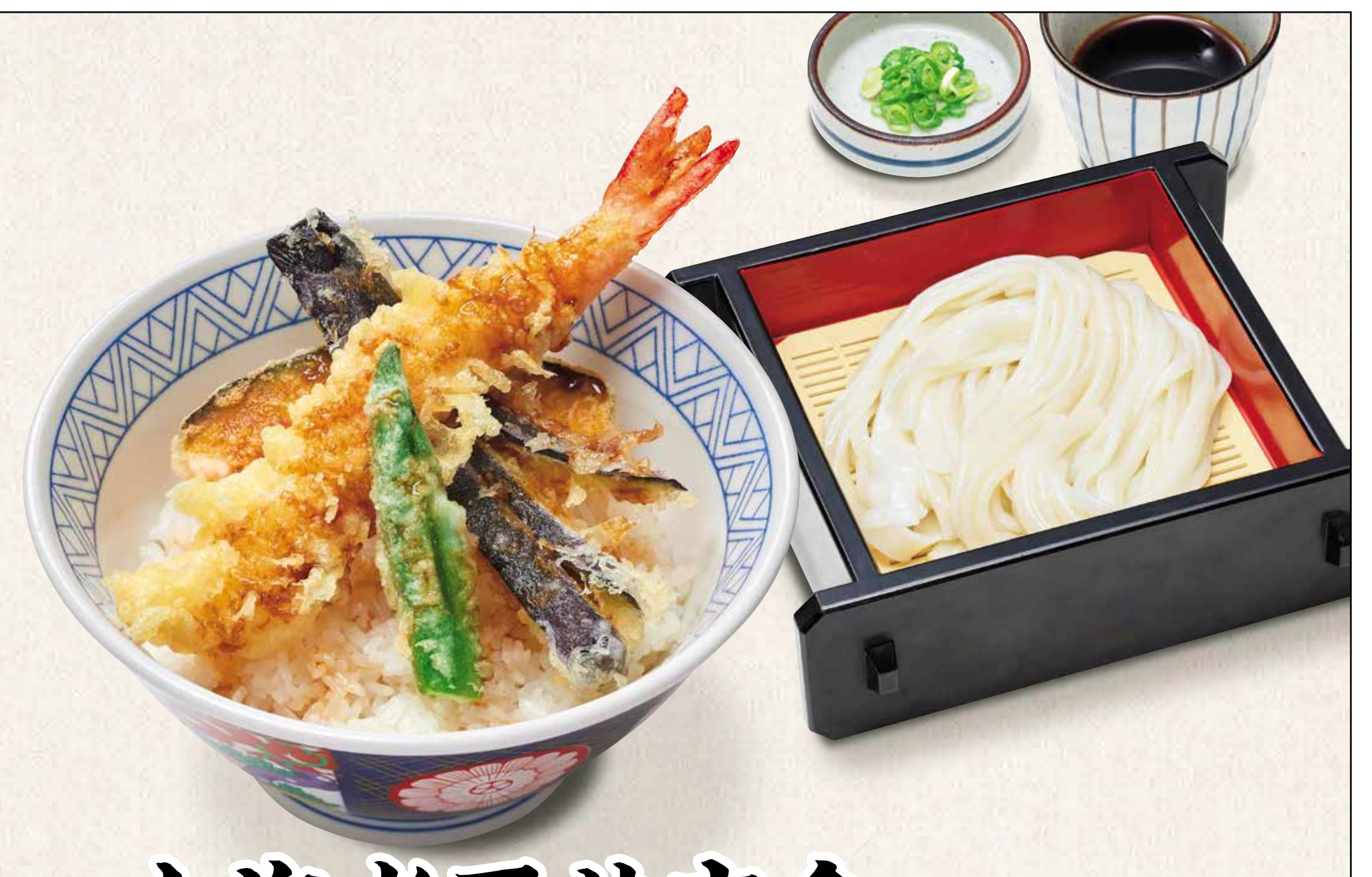
大海老天井定食うどん付き 海老1尾 1,030円 うどんは温冷選べます