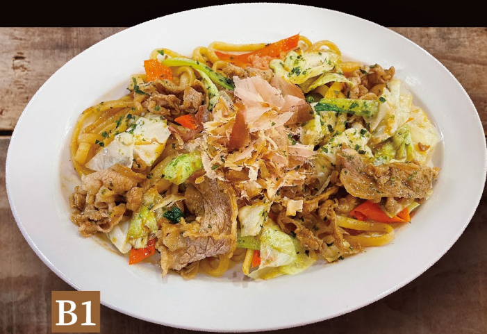
B1 MÌ UDON XÀO BÒ SỐT NHẬT ビーフ焼うどん (ソース味) Beef Fried Udon 160,000