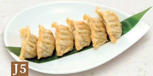
J5 GYOZA 餃子 Gyoza Dumpling 60,000/6P 100,000/10P