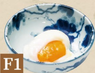
F1 TRỨNG ONSEN 温泉玉子 Soft Boiled Egg 13,000

F8 THÊM MÌ 麵大盛り Extra Noodles(1.5 Times) 27,000 F9 RAU THÊM 野菜大盛り Extra Vegetables 18,000