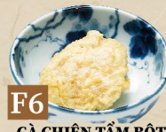
F6 GÀ CHIÊN TẨM BỘT (1 MIẾNG) とり天(1個) Chicken Tempura (1 Piece) 13,000