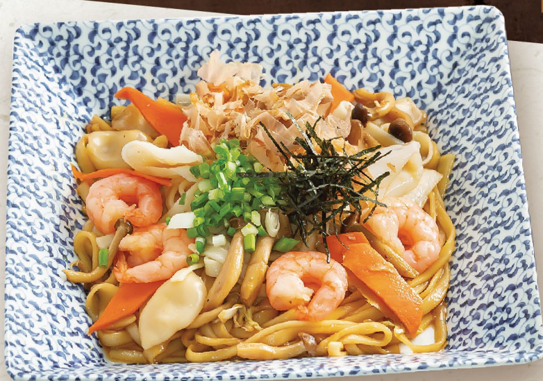
B5 MÌ UDON XÀO HẢI SẢN シーフード焼うどん Seafood Fried Udon 152,000