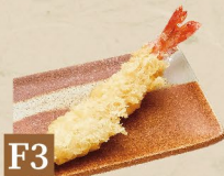
F3 TÔM CHIÊN TẨM BỘT 海老天 Prawn Tempura 23,000