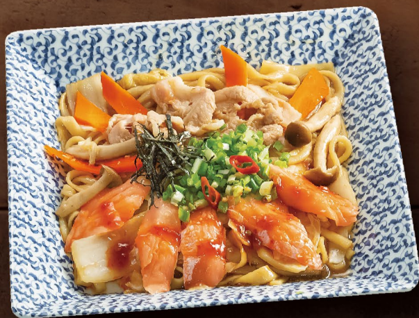
B4 MÌ UDON XÀO CÁ HỒI サーモン焼うどん Salmon Fried Udon 175,000