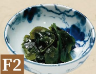
F2 RONG BIỂN NGÂM わかめ Seaweed 18,000