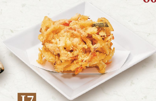
J7 RAU CỦ TRỘN CHIÊN 野菜かき揚げ Mixed Vegetable Tempura 41,000