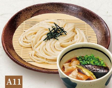
A11 MÌ UDON LẠNH & SÚP THỊT HEO 豚つけうどん Pork Dipping Udon 145,000