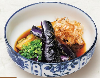
J8 CÀ TÍM CHIÊN NGÂM TƯƠNG なすの揚げびたし Deep Fries Eggplant In Broth 41,000