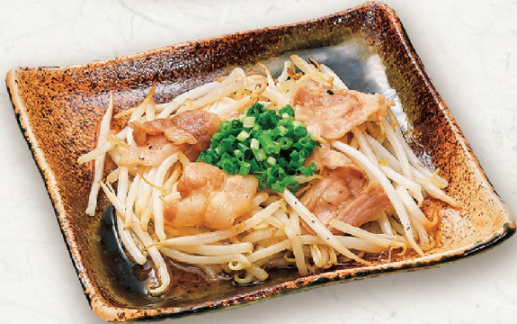
J6 GIÁ XÀO THỊT HEO 豚もやし炒め Stir-Fried Pork & Bean Sprouts 59,000