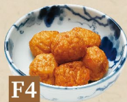
F4 CÁ VIÊN CHIÊN フィッシュボール Fish Ball 13,000