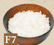
F7 CHÉN CƠM TRẮNG ごはん Rice 18,000