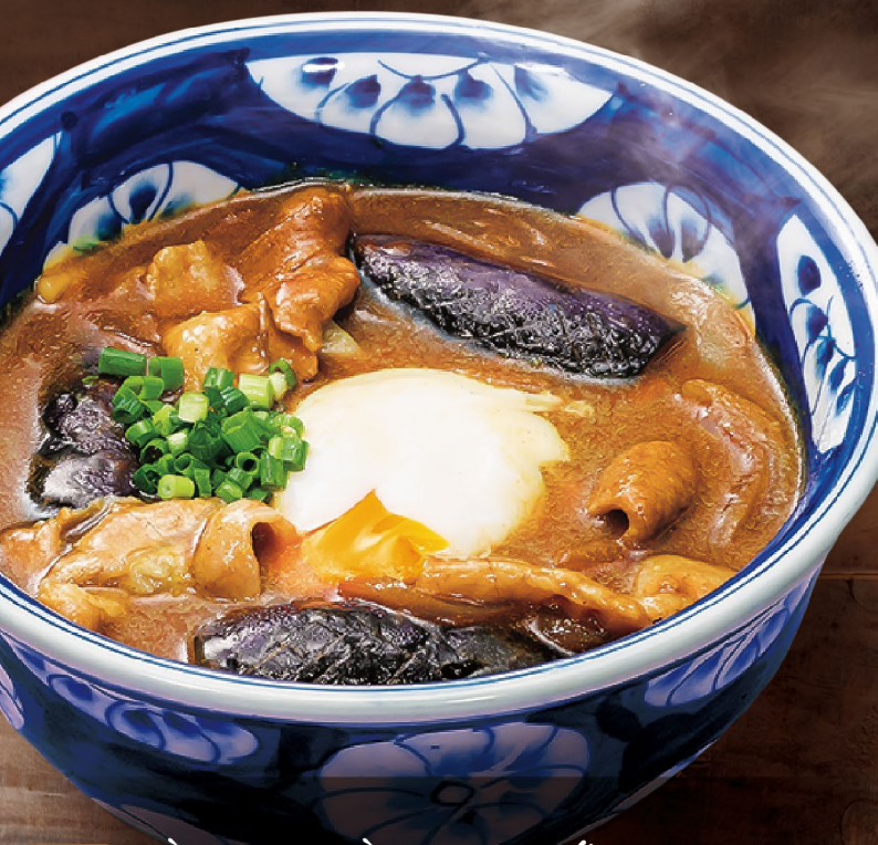
A4 MÌ UDON CÀ RI + TRỨNG ONSEN カレーうどん + 温玉 Curry Udon + Soft Boiled Egg 172,000