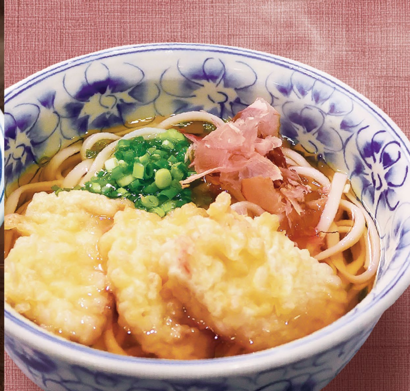
A6 MÌ UDON GÀ とり天うどん Chicken Tempura Udon 139,000