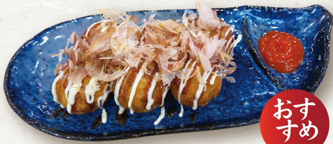
J4 BÁNH BẠCH TUỘC たこ焼き Takoyaki