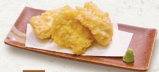
J11 GÀ CHIÊN TẦM BỘT (4 MIẾNG) とり天 Chicken Tempura 58,000