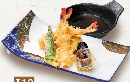
J10 TÔM VÀ RAU CỦ CHIÊN TẦM BỘT 天ぷら盛合せ Assorted Tempura 87,000