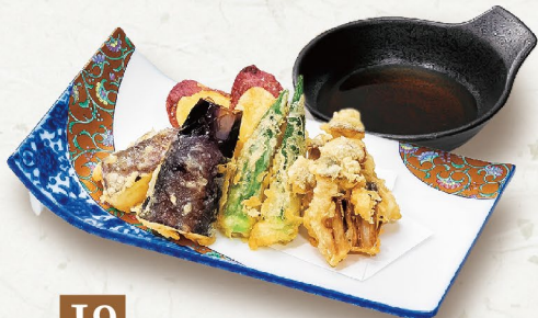
J9 RAU CỦ CHIÊN TẦM BỘT 野菜天ぷら盛合せ Assorted Vegetable Tempura 70,000