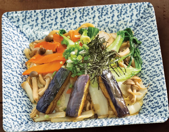
B3 MÌ UDON XÀO RAU CỦ ベジ焼うどん Vegetable Fried Udon 149,000