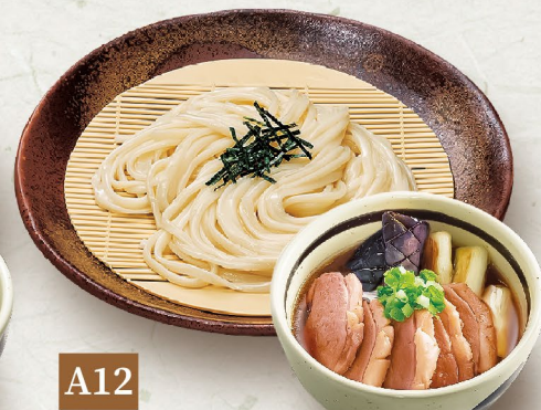
A12 MÌ UDON LẠNH & SÚP THỊT VỊT 鴨つけうどん Duck Dipping Udon 149,000