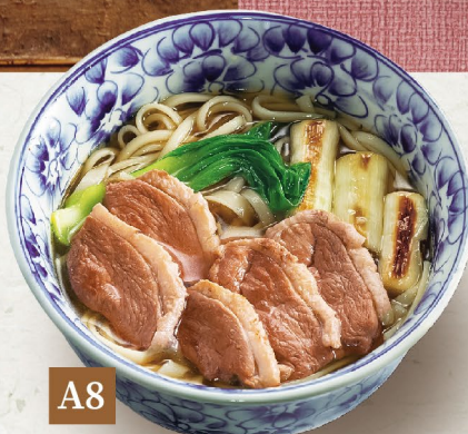
A8 MÌ UDON VỊT 鴨うどん Duck & Green Onions Udon 149,000