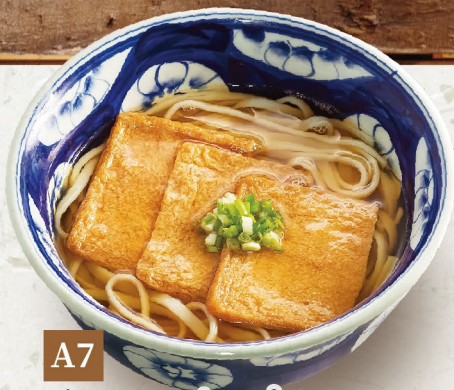
A7 MÌ UDON ĐẬU HŨ (NGỌT) きつねうどん Hot Udon With Sweetened Deep Fried Bean Curd 135,000