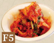
F5 KIMCHI キムチ Kimchi 18,000