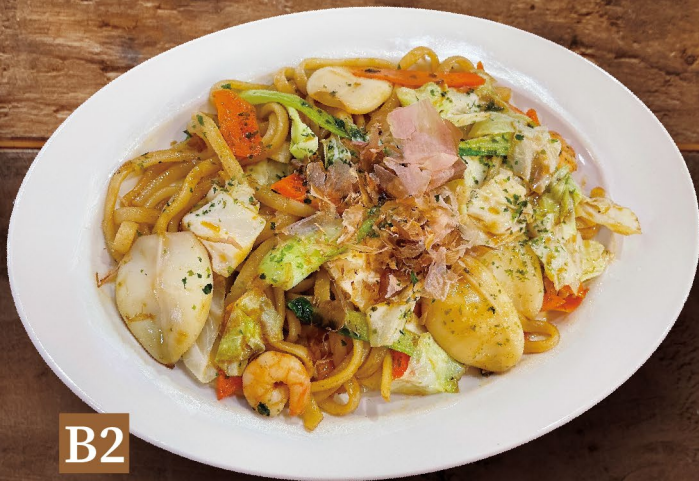
B2 MÌ UDON XÀO HẢI SẢN SỐT NHẬT シーフード焼うどん (ソース味) Seafood Udon 152,000