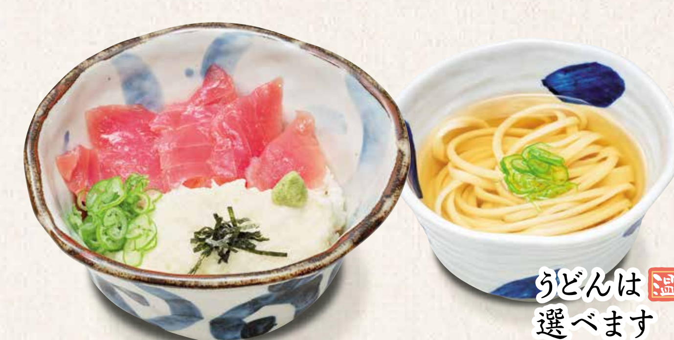
まぐろ山かけ井定食うどん付き 980円