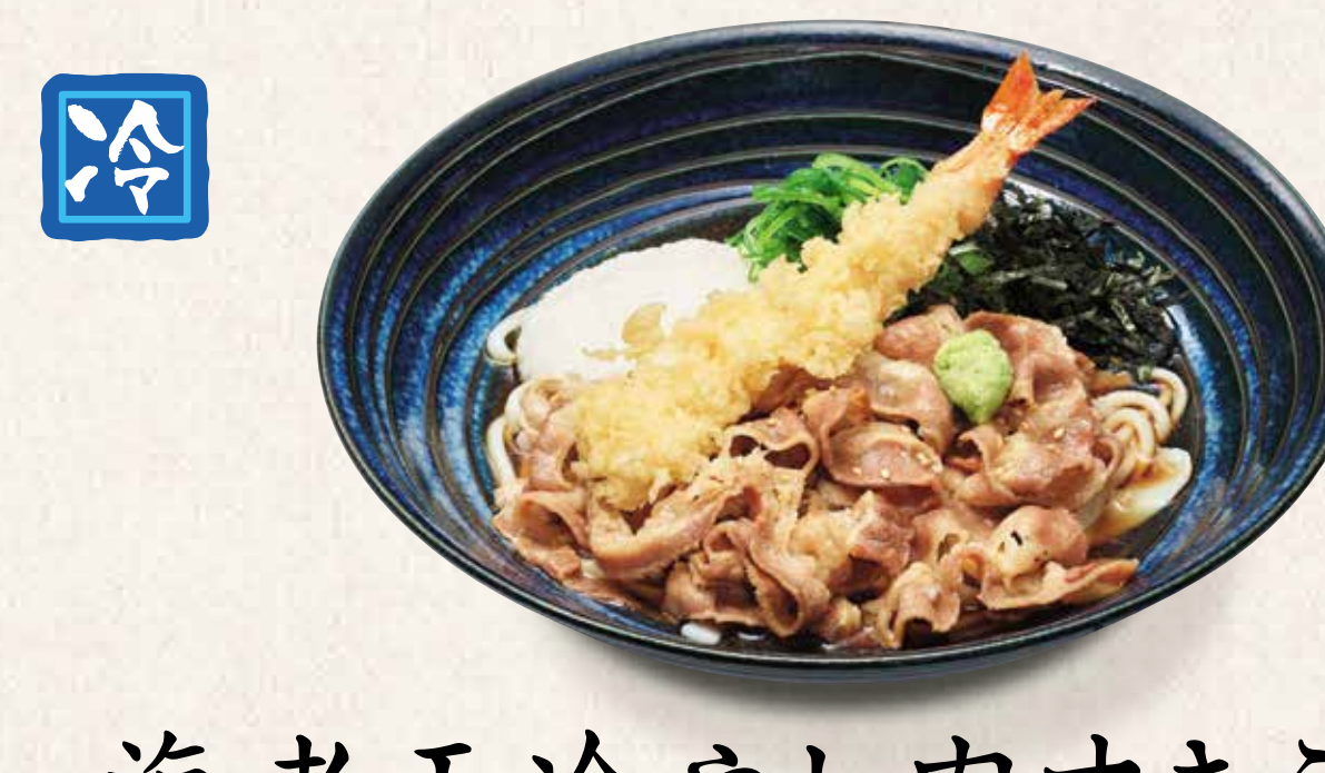
海老天冷やし肉すきうどん 1,180円