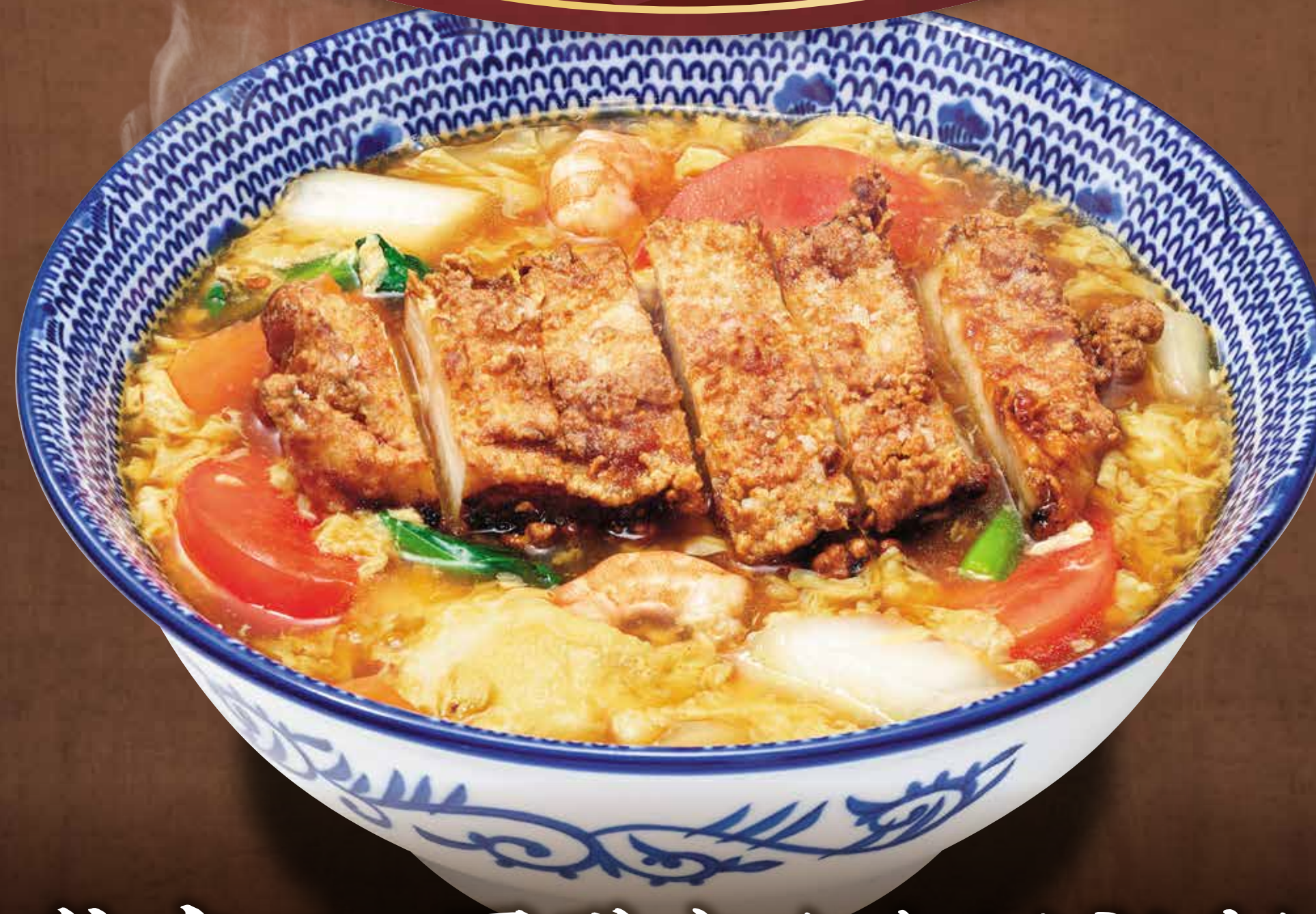
鶏竜田の黒酢あんかけうどん 1,190円