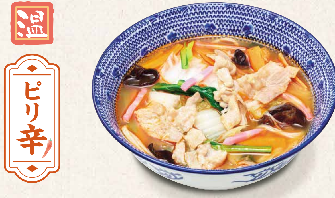
チゲちゃんぽんうどん 940円