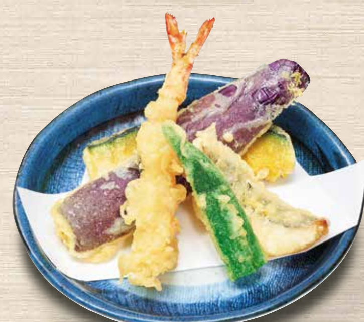
天ぷら盛り合わせ 450円