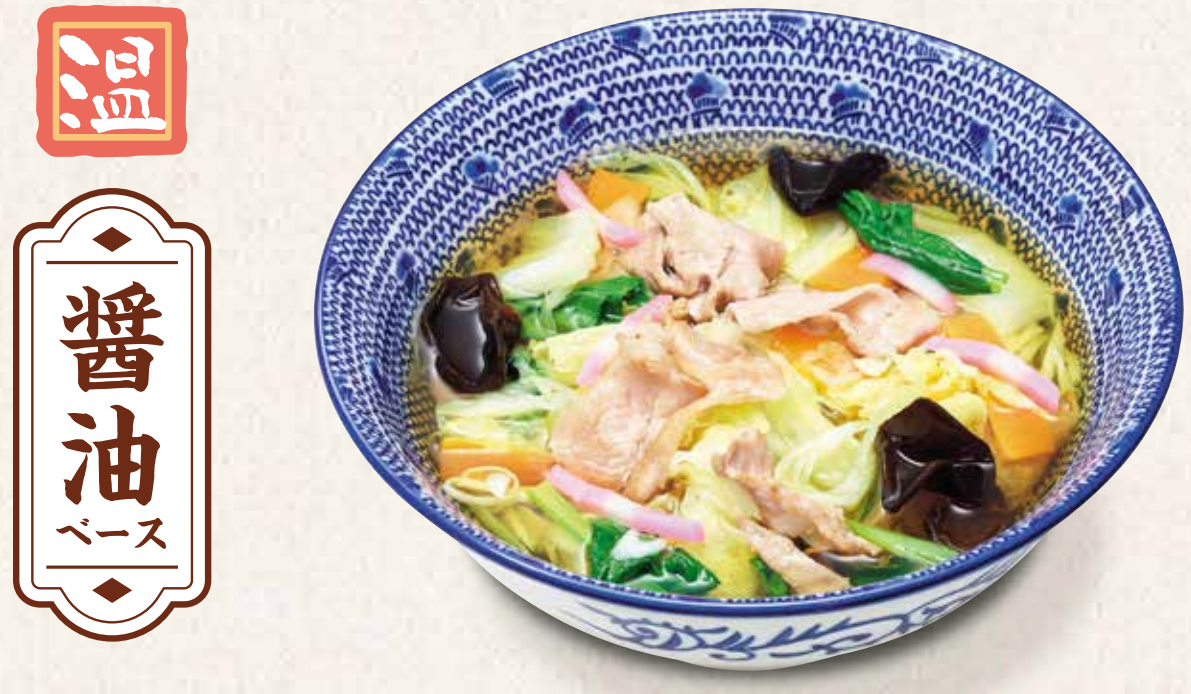
水山ちゃんぽんうどん 940円