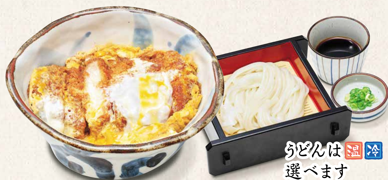
コースかつ井定食うどん付き 980円