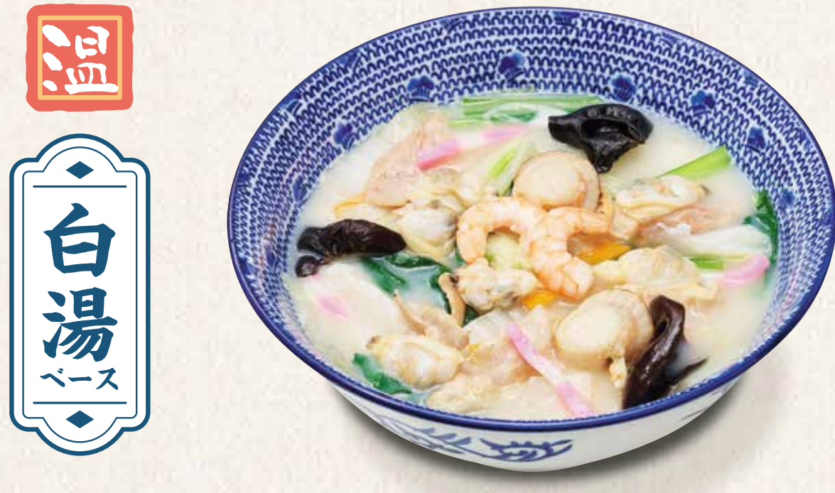
海鮮長崎ちゃんぽんうどん 1,140円