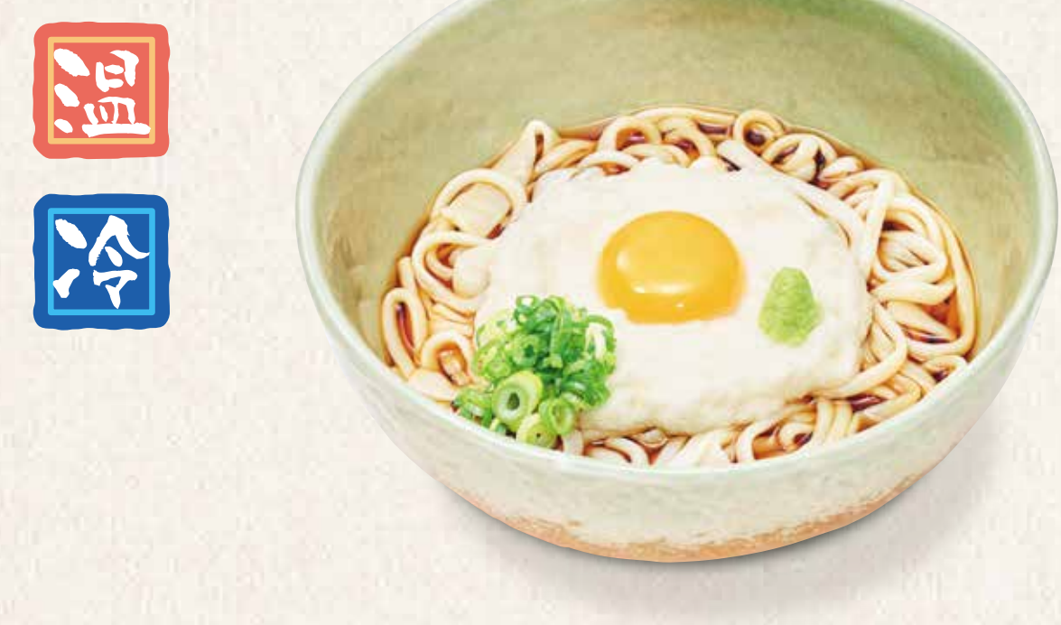
北海道産とろろのうどん 840円