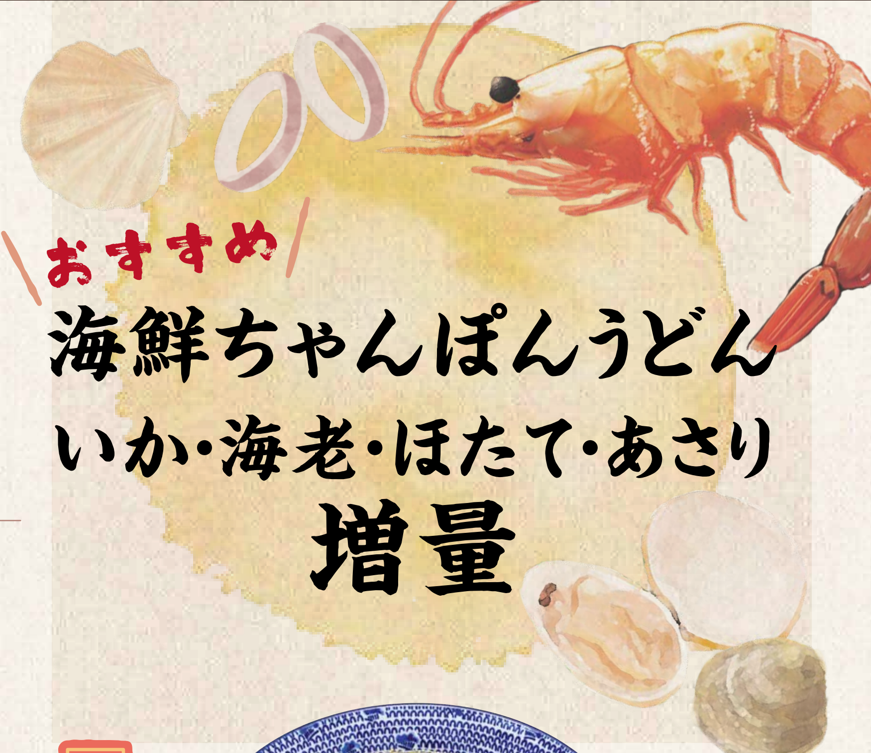
おすすめ 海鮮ちゃんぽんうどん いか・海老・ほたて・あさり 増量