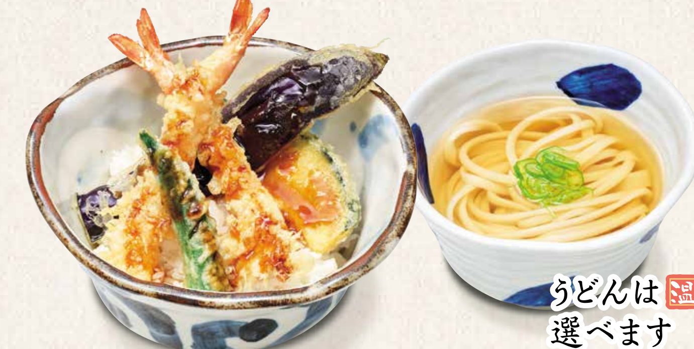
天井定食うどん付き 980円