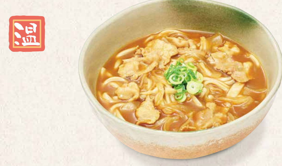
こく旨カレーうどん 890円