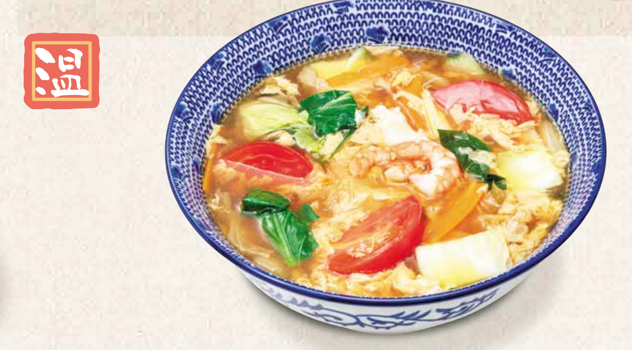
黒酢あんかけうどん 990円