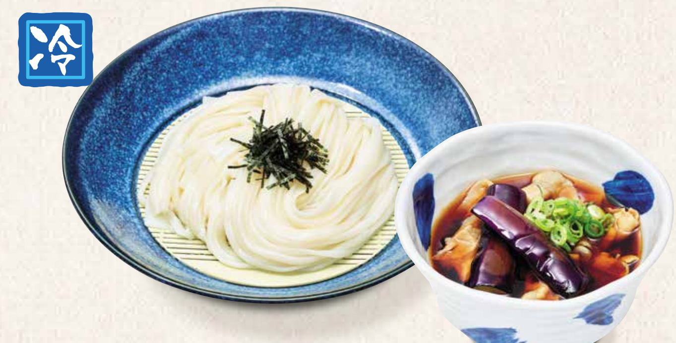
柚子胡椒の豚つけうどん 910円