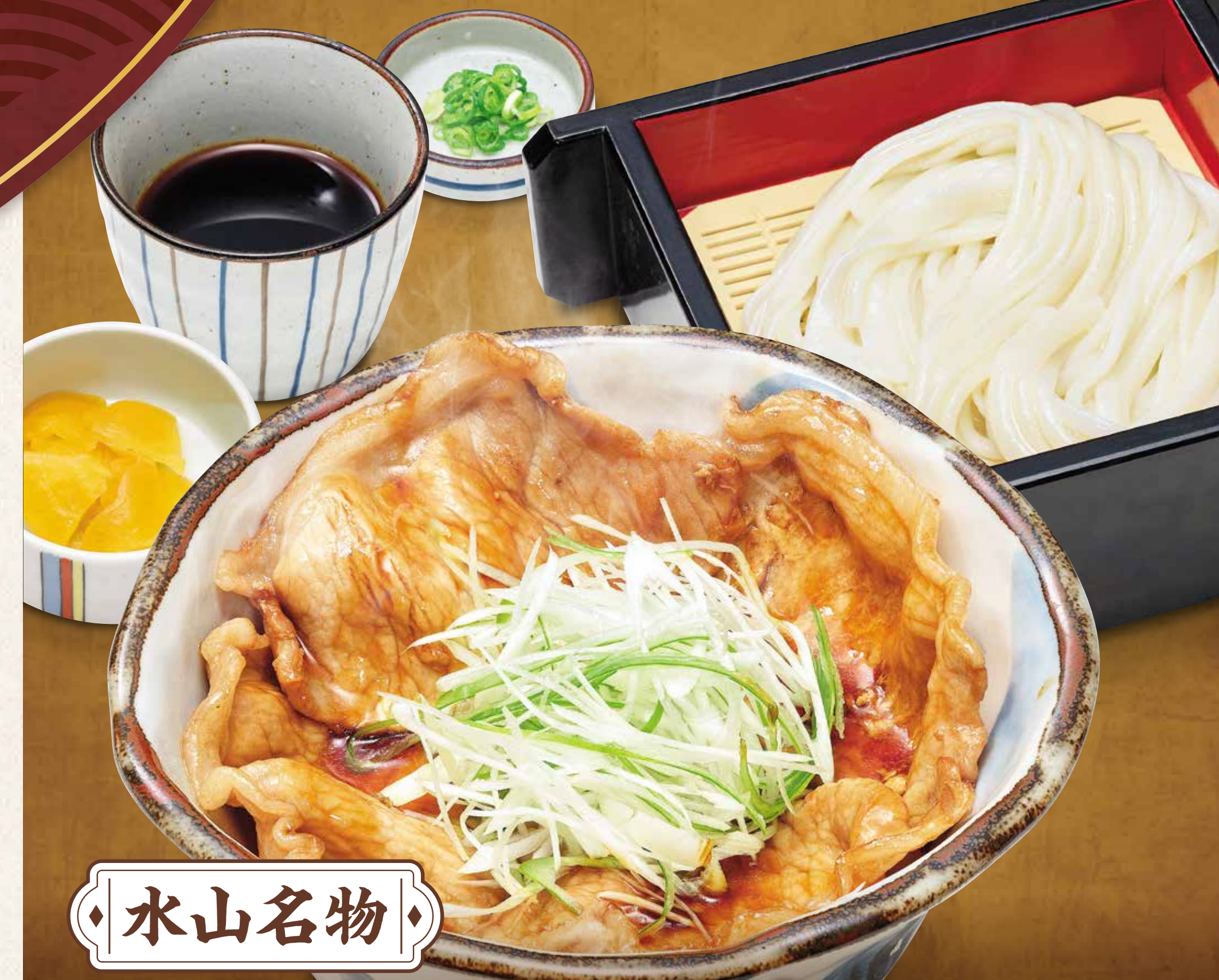
水山名物 四元豚の豚井定食うどん付き 1,080円 うどんは冷選べます 四元豚の豚井定食 味噌汁付き 1,050円