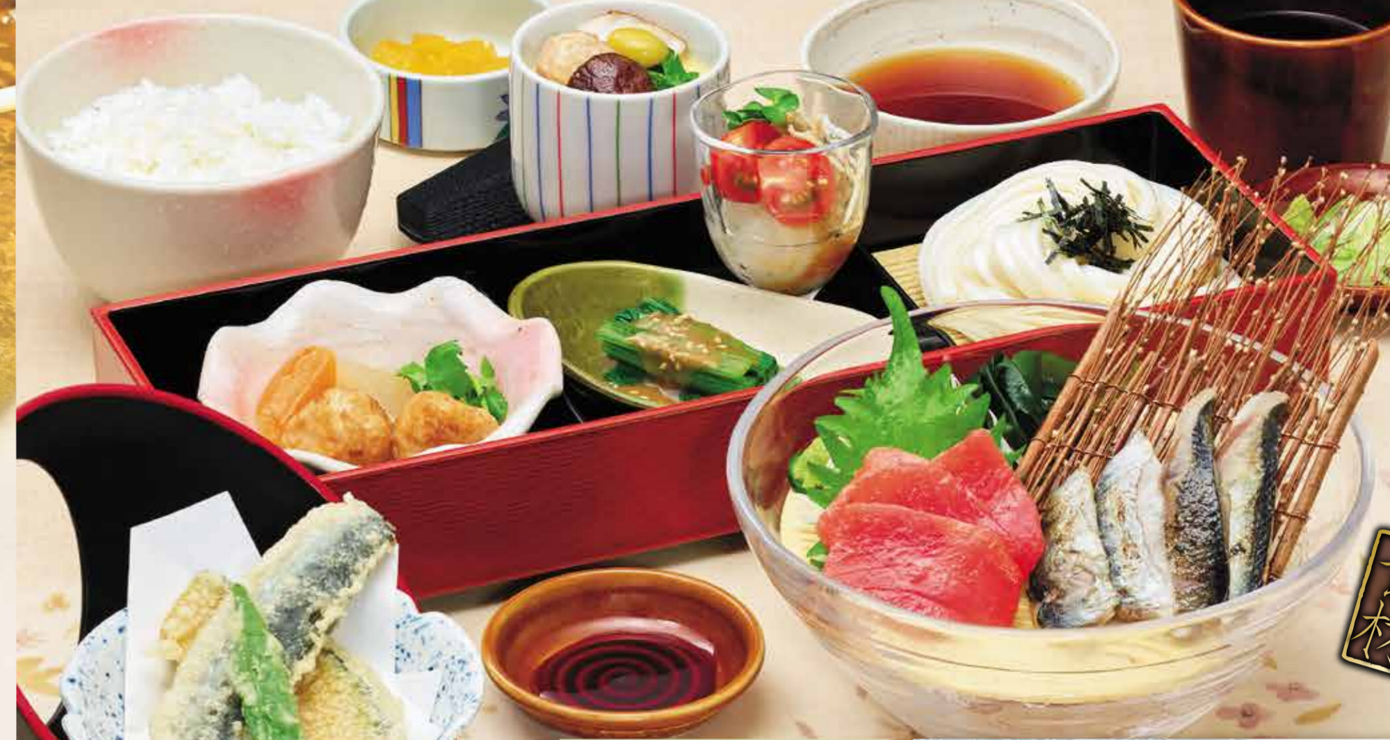
『初夏の天ぷらとお刺身和膳』 1,628円 (税1,790円)