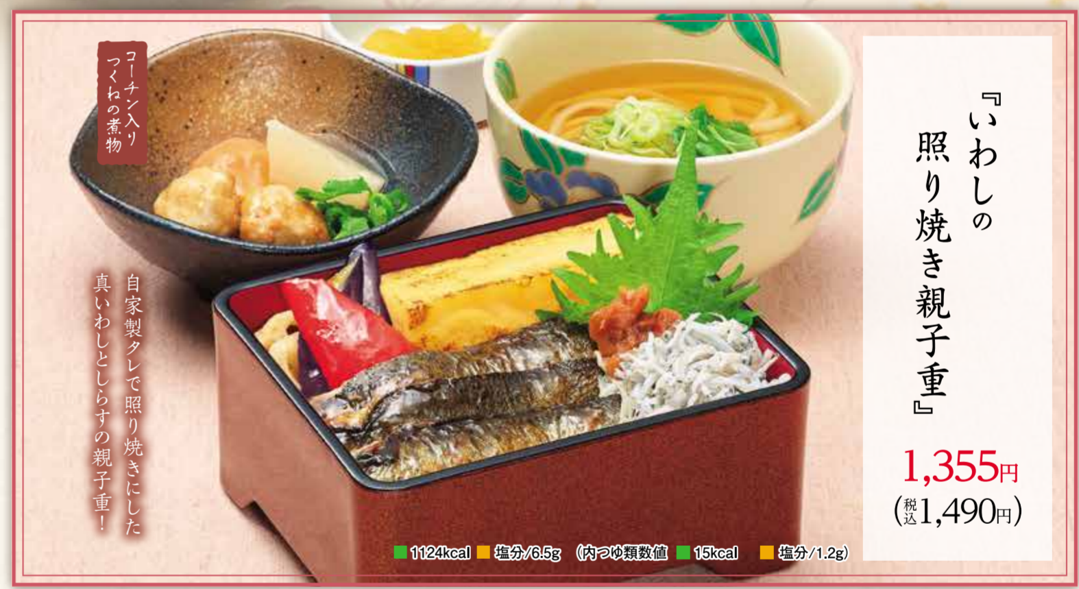
『いわしの 照り焼き親子重』 1,355円 (税1,490円)

いわしはDHAとEPAを バランスよく含んでおり、 カルシウムも豊富！旬の脂の乗った 真いわしをお楽しみください。