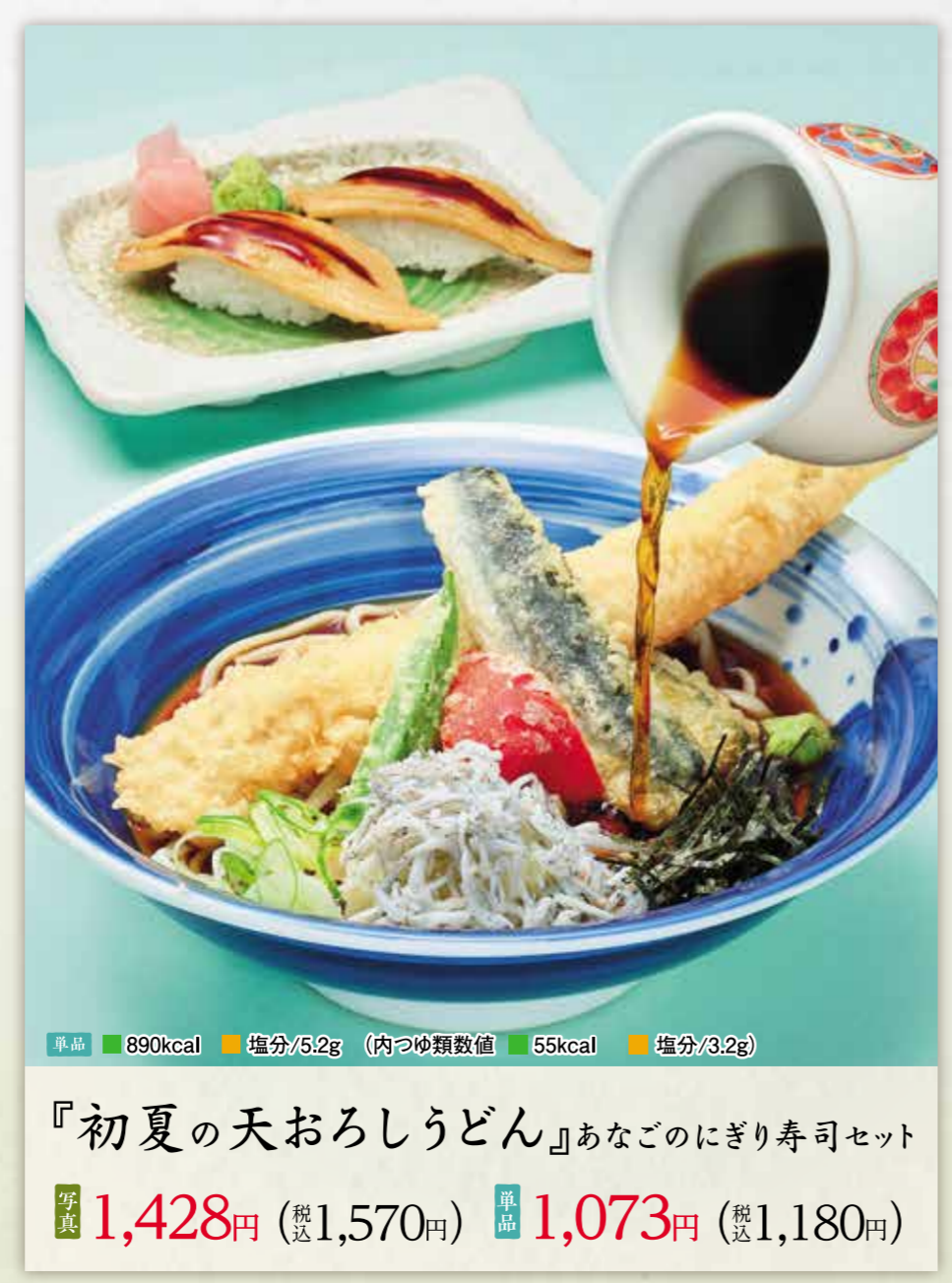
『初夏の天おろしうどん』あなごのにぎり寿司セット 写真 1,428円 (税1,570円) 単品 1,073円 (税1,180円)

1241kcal 塩分/6.6g (内つゆ類数値) 28kcal 塩分/1.9g