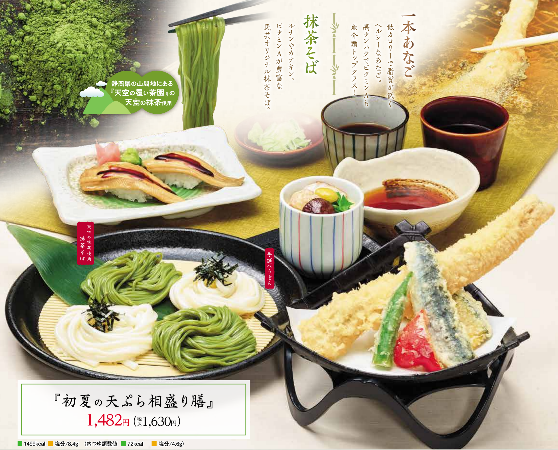
『初夏の天ぷら相盛り膳』 1,482円 (税1,630円)

1499kcal 塩分/8.4g (内つゆ類数値) 72kcal 塩分/4.6g