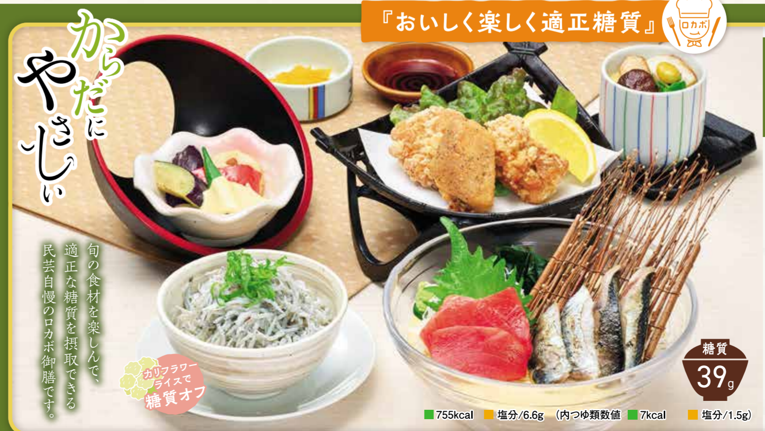
『おいしく楽しく適正糖質』