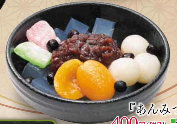
『あんみつ』 400円(税別) ■263kcal ■塩分/0.1g