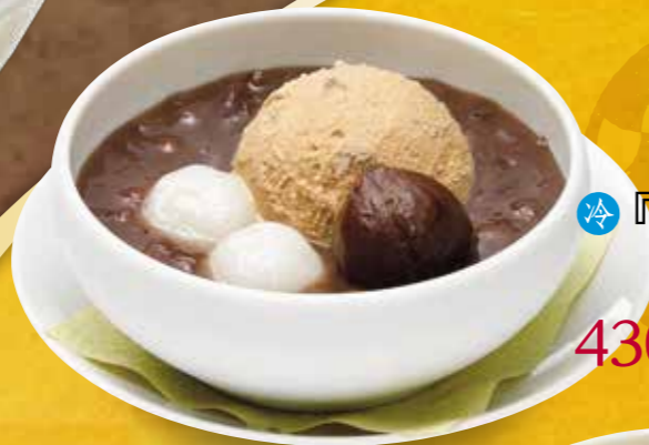
『渋皮栗のおしるこ』 430円(税別) ■384kcal ■塩分/0.2g