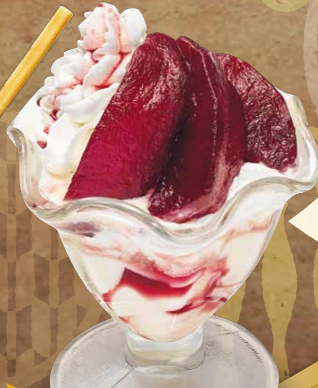
『季節の杏仁豆腐』 りんごの赤ワイン煮 490円(税別) ■203kcal ■塩分/0.1g