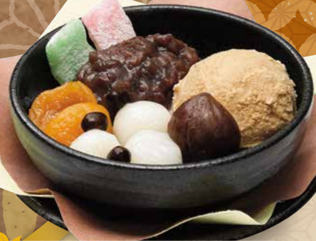
『渋皮栗のあんみつ』 520円(税別) ■381kcal ■塩分/0.1g