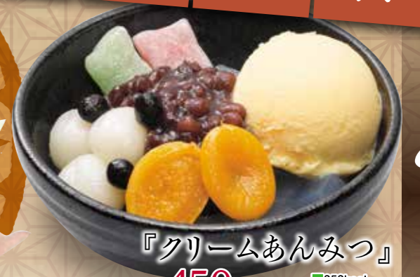
『クリームあんみつ』 450円(税別) ■353kcal ■塩分/0.1g