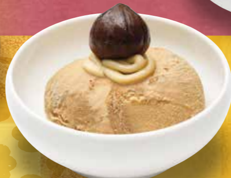
『二色アイス』 (渋皮栗×バナラ) 280円(税別) ■171kcal ■塩分/0.1g