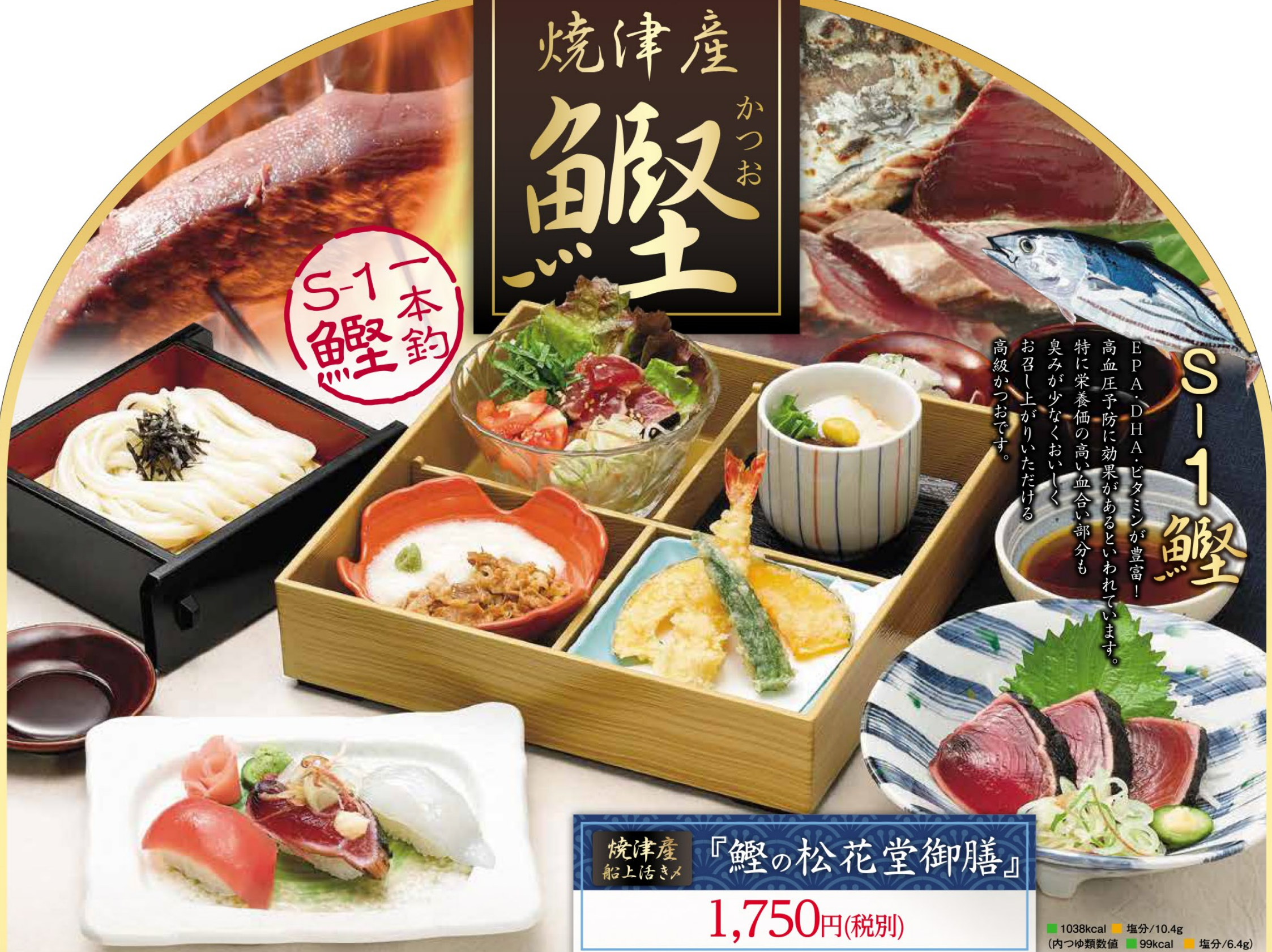
焼津産 船上活きメ 『鰯の松花堂御膳』 1,750円(税別)

S-1 鰯 EPA、DHA、ビタミンが豊富！ 高血圧予防に効果があるといわれています。 特に栄養価の高い血合い部分も 臭みが少なくおいしく お召し上がりいただける 高級かつおです。